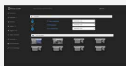
Gebruiksvriendelijke webapplicatie met overzichtelijk menu